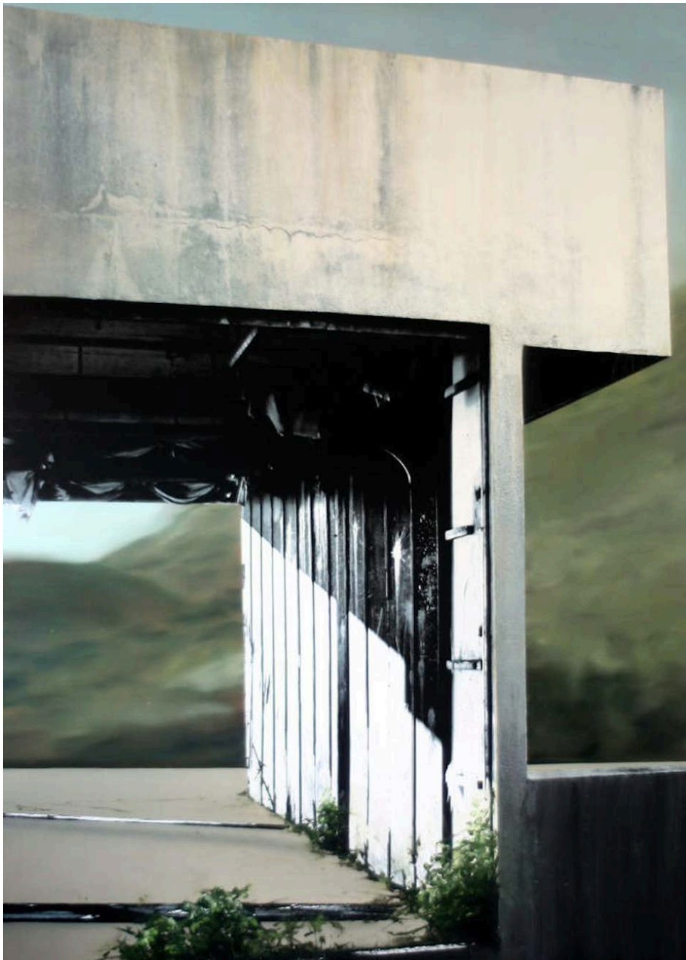
Eva Nielsen, Display , 2014, encre sérigraphie et acrylique sur toile, 190x140cm

[ ] De la sorte, en rassemblant une trentaine de pièces, l'exposition Art [ ] Collector 5 x 2 constitue un tout orchestré autour de la ligne directrice qui singularise cette manifestation périodique, celle du rôle du collectionneur et de sa relation à l'artiste. Elle permettra d'en donner à voir un panel représentatif, tout en contribuant en même temps à la défense et à la promotion d'une vision singulière de l'art contemporain, telle qu'elle ressort de la sélection opérée chaque année par le Comité de Sélection d'Art [ ] Collector.