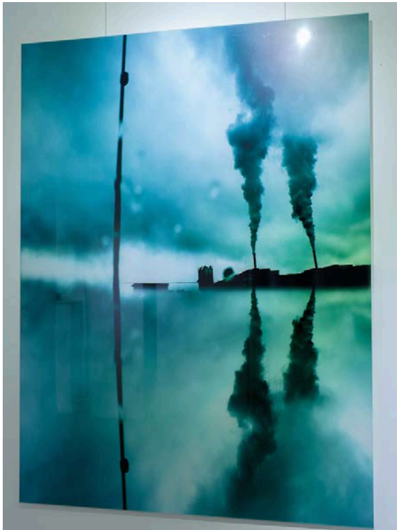
Christine Barbe, Série Paysages Mutations Venise-Avignon, photographie, 90X120cm

Présentée du 14 novembre au 3 décembre 2016 au Patio Art Opéra Paris, l'exposition sera ensuite montrée à la Patinoire Royale/Valérie Bach à Bruxelles, à l'automne 2017, permettant ainsi au programme d'Art [ ] Collector d'élargir son engagement de soutien et de promotion des artistes, en les accompagnant désormais à l'international et en partageant ses coups de coeur avec de nouveaux collectionneurs et amateurs.